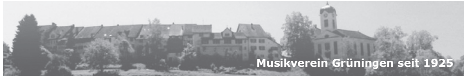
Musikverein Grüningen seit 1925

Wir freuen uns sehr, Sie am zweiten Adventwochenende an einem unserer Konzerte begrüssen zu dürfen.